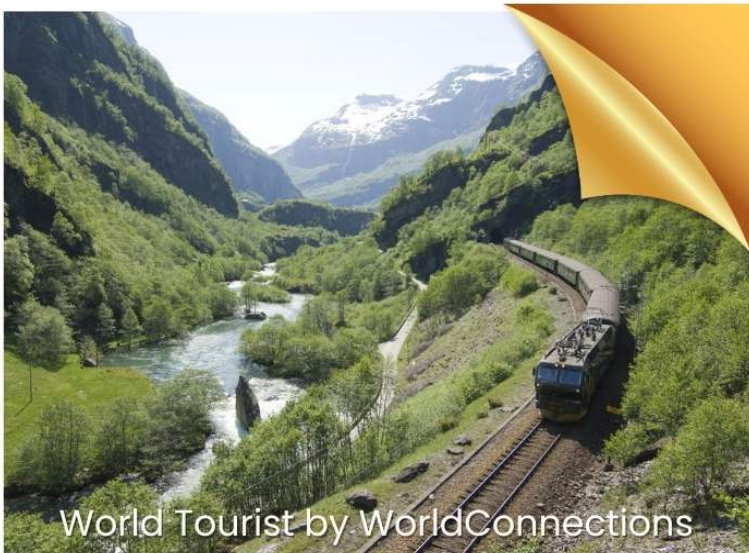
World Tourist by WorldConnections