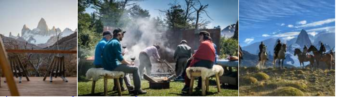
เที่ยง บริการอาหารมื้อกลางวัน แบบ BBQ พื้นเมือง

นำท่านร่วมจัดกิจกรรมตามเส้นทางชมวิวยอดเขาไฟท์ซรอย(Monte Fitz Roy) ทุกท่านจะได้ ขี่ม้า พายเรือคายัค และเดินป่า(ระยะใกล้ 1 ชม.) และรวมถึงได้ทาน BBQ พื้นเมืองรสเลิศ นำท่านขี่ม้า(Horse Riding) ประมาณสอง ชั่วโมง ชมวิวที่สวยงามระหว่างเส้นทาง จนกระทั่งเข้าสู่แคมป์ลากูนา ลิต้า (Camp Laguna Lita) ภายในแคมป์ลากูนา ลิต้า จะมีแอ่งที่น้ำใสราวกระจกสวยงามที่สุดแห่งหนึ่ง และที่พักสำหรับนักท่องเที่ยว