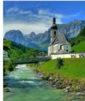
ออสเตรียบาวาเรียดินแดน แห่งเทพนิยาย

ออสเตรีย – บาวาเรีย (Austria-Bavaria) ดินแดนวัฒนธรรมเก่าแก่ที่ครอบคลุมสองประเทศและแทบแยกกันไม่ออกเลยที่เราเที่ยวอยู่ในออสเตรียหรือเยอรมัน ท่านจะประทับใจไปกับหมู่บ้านเล็กๆน่ารัก ที่ตั้งอยู่บริเวณริมทะเลสาบในเทือกเขา “เยอรมัน-ออสเตรียแอลป์” พร้อมบริการอาหารรสเลิศและที่พักอย่างดีระดับ 4 ดาว หรรษาที่เราคัดสรรมาให้ท่านได้พักผ่อนอย่างเต็มที่ให้การเดินทางของทุกท่านคุ้มค่าที่สุดในเส้นทางที่สวยงามที่สุดของออสเตรีย-บาวาเรีย