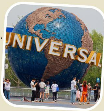
5 UNIVERSAL BEIJING