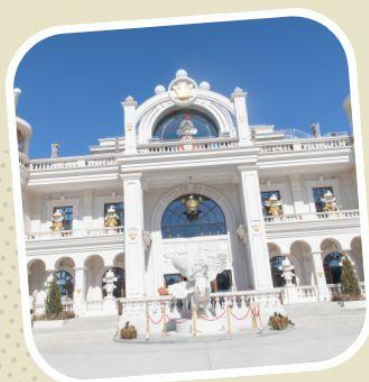
6 POP LAND