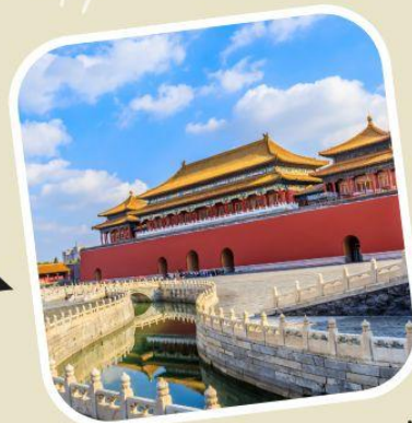
3 พระราชวังต้องห้าม