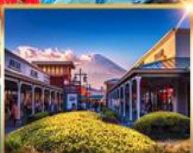
ช้อปปิ้ง ย่านชินจูกุ