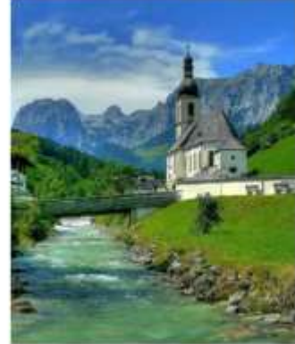
ออสเตรียบาวาเรียดินแดน แห่งเทพนิยาย

ออสเตรีย – บาวาเรีย (Austria-Bavaria) ดินแดนวัฒนธรรมเก่าแก่ที่ครอบคลุมสองประเทศและแทบแยกกันไม่ออกเลยที่เราเที่ยวอยู่ในออสเตรียหรือเยอรมัน ท่านจะประทับใจไปกับหมู่บ้านเล็กๆน่ารัก ที่ตั้งอยู่บริเวณริมทะเลสาบในเทือกเขา “เยอรมัน-ออสเตรียแอลป์” พร้อมบริการอาหารรสเลิศและที่พักอย่างดีระดับ 4 ดาว หรูหราที่เราคัดสรรมาให้ท่านได้พักผ่อนอย่างเต็มที่ให้การเดินทางของทุกท่านคุ้มค่าที่สุดในเส้นทางที่สวยงามที่สุดของออสเตรีย-บาวาเรีย