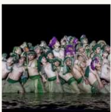
ชมโชว์ Hoi An Memories