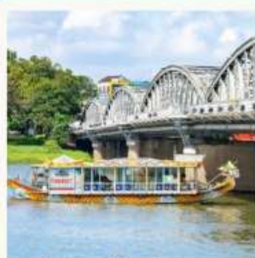
ล่องเรือมังกร แม่น้ำหอม