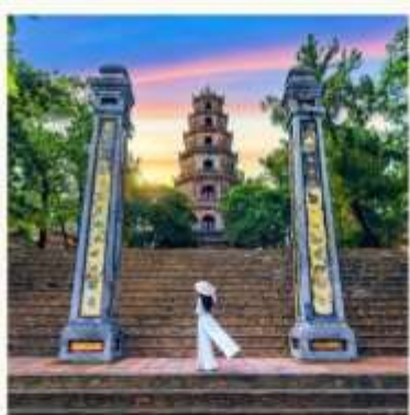
วัดเทียนมู่