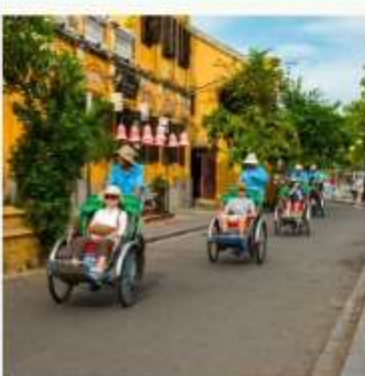
นั่งสามล้อชมเมือง