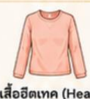
สวมเสื้อฮีทเทค (Heattech) ไร์ดาวน์เพื่อเพิ่มความอบอุ่น แทนการใส่เสื้อหลายๆ ชั้น