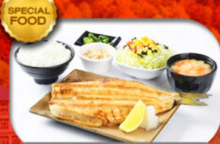
เมนูพิเศษ Set ปลาซอกเกะ