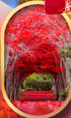
สวนฮิราโอกะ