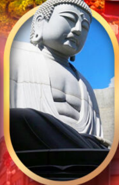
พระใหญ่อะตะมะ