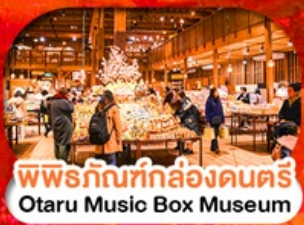
พิพิธภัณฑ์กล่องดนตรี Otaru Music Box Museum