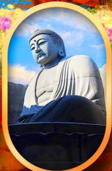
เนินเงาแห่งพระพุทธรเจ้า