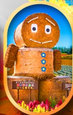
ชิกิไซ โนะโอะกะ