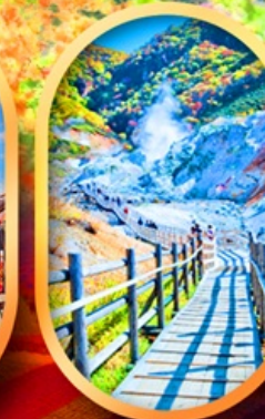
หุบเขานรกจิดอกุคาบิ