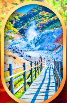
หุบเขานรกจิโศคคาบิ