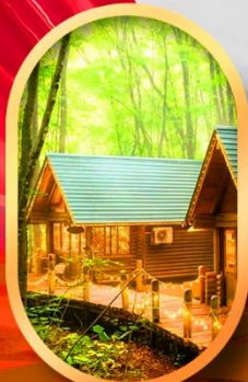
นิงเกิลเกอเรส