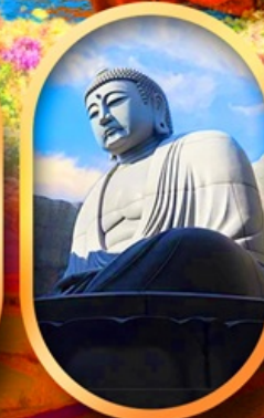
เบนเนฮาแห่งพระพุทธรเจ้า