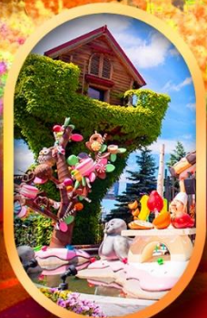
โรงงานช็อกโกแลต