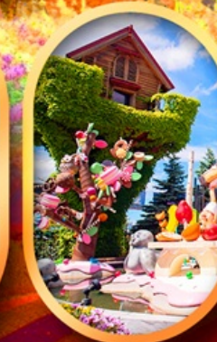
โรงงานช็อกโกแลต