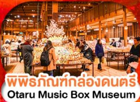
พิพิธภัณฑ์กล่องดนตรี Otaru Music Box Museum