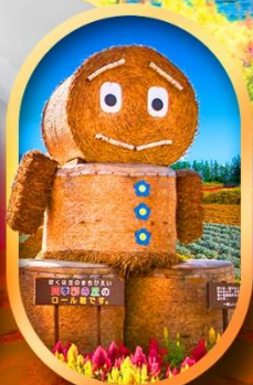
ซึกิโซ โนะโอะกะ