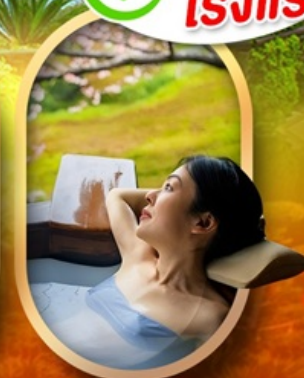
แช่ออนเซ็นญี่ปุ่น