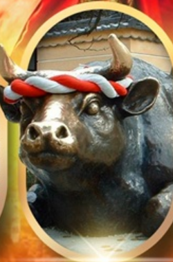
ศาลเจ้าคาโซฟู