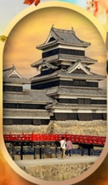
ปราสาทคุมาโมโตะ