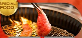
อาหารมือพิเศษ ปิ้งย่างยากินิกุ