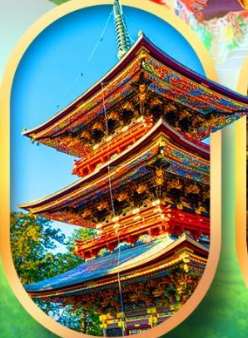
วัดนาริตะ-ซัง