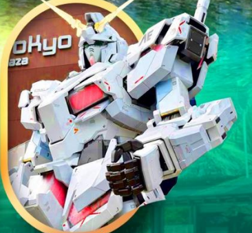
ห้างโอไดบะ-กันดั้ม