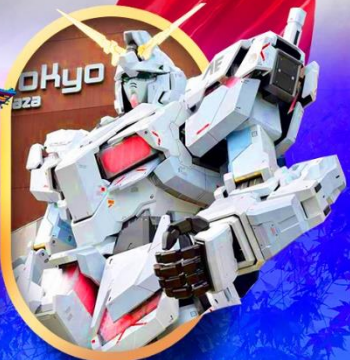
ห้างไอโดปะกันดั้ม