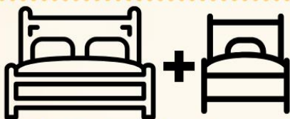
1เตียงใหญ่+1เตียงเสริม

ห้องพักสำหรับ 2 ท่าน ห้องพักมีจำนวนน้อย และมีขนาดห้องเล็กกว่า ห้องTWN