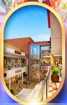
บิตซูเอาก์ลีต