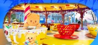
Fuji q Highland x Butterbear เดินทาง พ.ค. 69 เป็นต้นไป