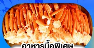
อาหารมือพิเศษ บุฟเฟ่ต์งาปู