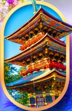
วัดนาริตะซัน