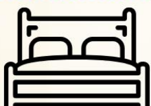
4.5-5ฟุต 1เตียง

ห้องพักเตียงดับเบิล DOUBLE BED ROOM (DBL)