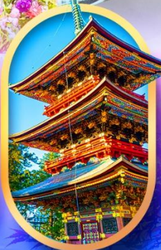
วัดนาริตะ-ซัน