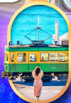
ถนนโคมาจิโดริ

✔️ ฟรี สวมใส่ ชุดยูคาตะ ถ่ายรูปเช็คอินสวยๆ