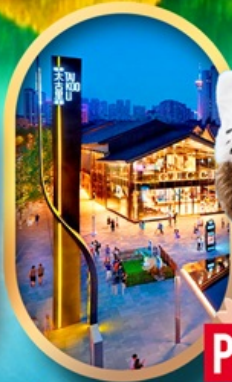
ถนนคนเดินไท่กู่หลี่