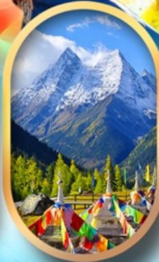
อุทยานสีดรุณี