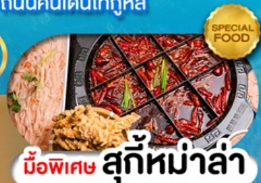
มือพิเศษ สุกี้หม่าล่า