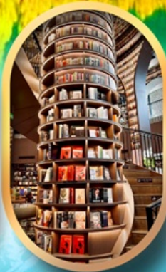
ร้านขายหนังสือ