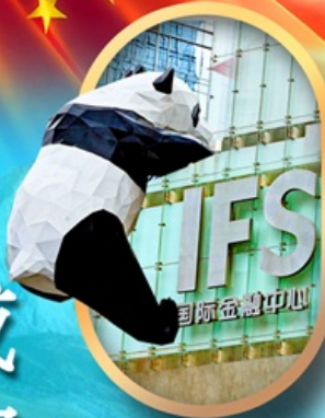
IFS หมีแพนด้าป็นตึก