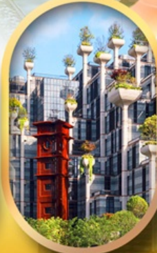
อาคารพินตันโบ