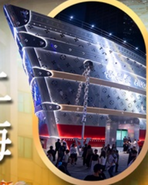
เรือเดอะหลุยส์