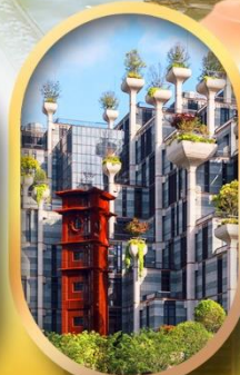
อาคารพินตันไม้