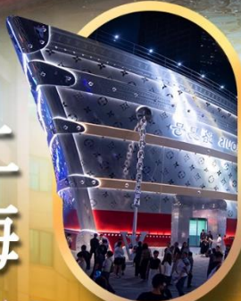
เรือเดอะหลุยส์