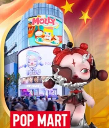
ช้อปปิ้งร้าน Pop Mart