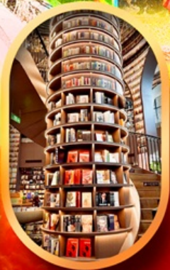
อุทยานปี้เฉิงโกว