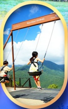
ฮาคุบะ อิวาตากะ