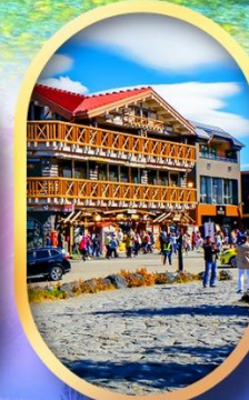
ภูเขาไฟฟูจิ ชั้น 5