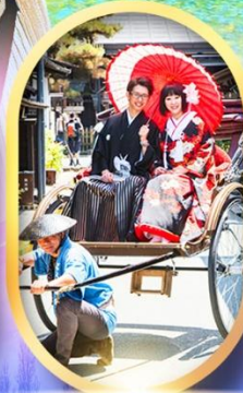
เมืองเก่าทาคายาม่า