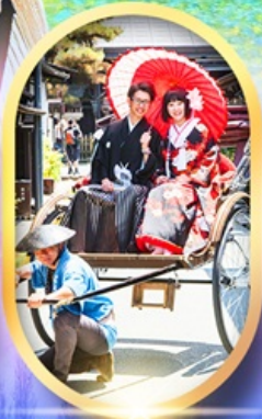
เมืองเก่าทาคายาม่า