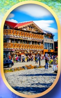
ภูเขาไฟฟูจิ ชั้น 5