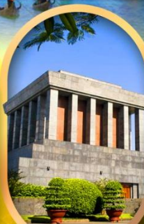
จัตุรัสบางคิงห์