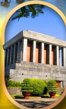
จัตุรัสบางคิงห์