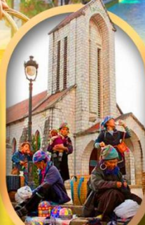
โบสถ์หินซาปา