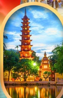
วัดเจินทิว๊ก