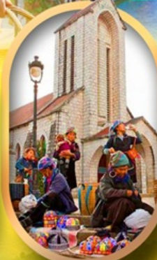
โบสถ์หินซาปา