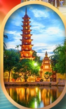
วัดเงินทิวัก