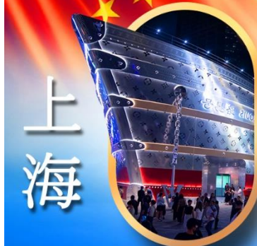
เรือเดอะหลุยส์