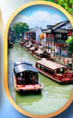
ถนนชานกิ่งเจีย