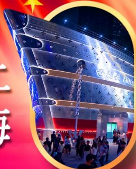
เรืออะทลันติก