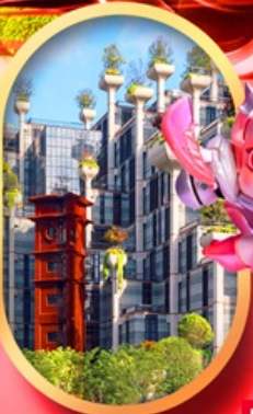
อาคารพันต้นไม้