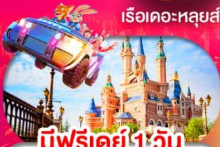
มีฟรีเคย์ 1 วัน