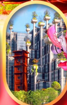
อาคารพินตันโบ