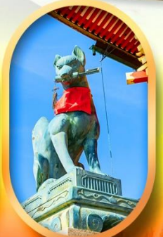
ศาลเจ้าจิ้งจอก