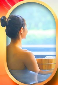
พักโรงแรมออนเซ็น