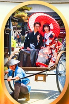
เมืองเก่าทาคายามา