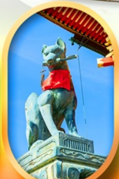
ศาลเจ้าจิ้งจอก