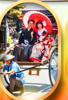
เมืองเก่าทาคายาม่า