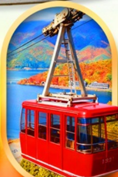
ขึ้นกระเช้าทะเลสาบมิกะตะ