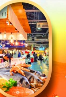
ตลาดปลาโงโถ