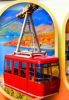
ขึ้นกระเช้าทะเลสาบมิกะตะ