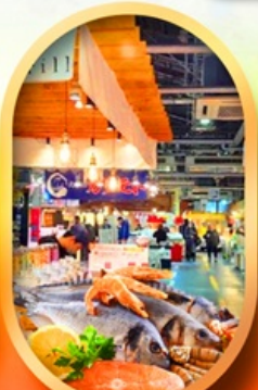
ตลาดปลาฮงโด