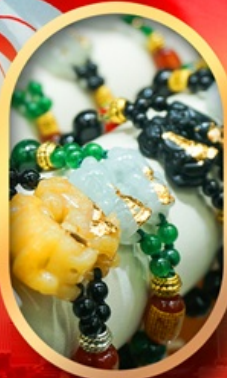
ร้านหยกอัญมณี