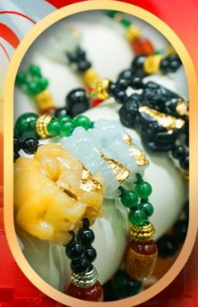
ร้านหยกอัญมณี