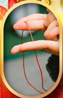
เสริมดวงความรัก