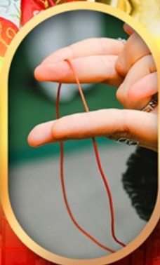
เสริมดวงความรัก