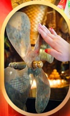
หมอนกั้งหับแซง