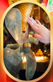
หมอนกั๊กหันแซง