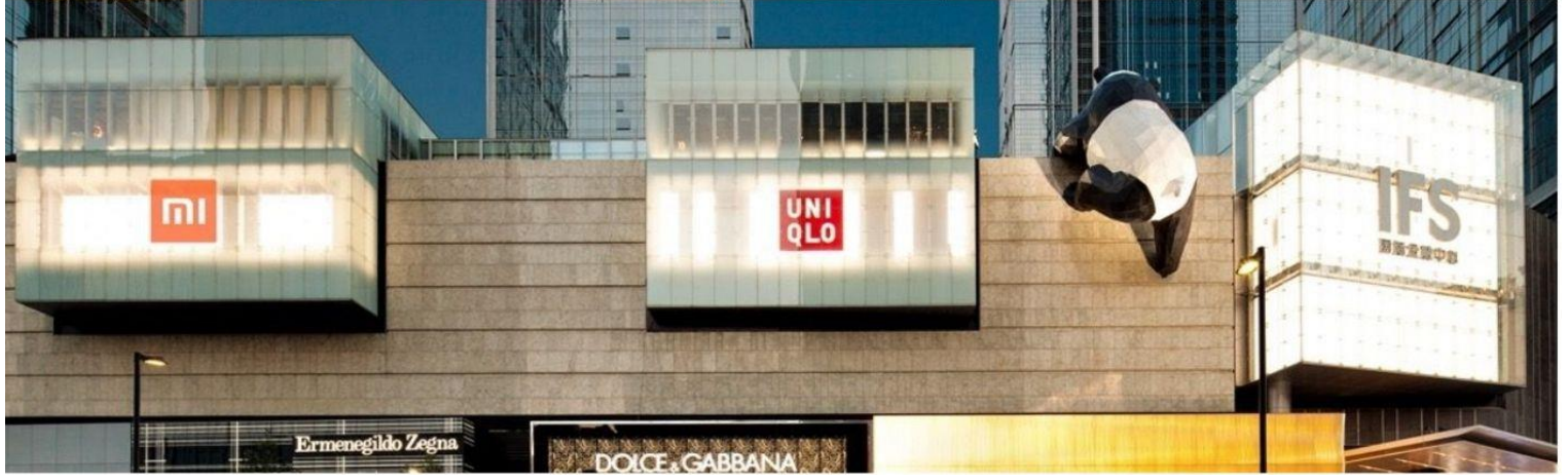
นำท่านสู่จุดเช็คอิน หมีแพนด้ายักษ์ปิ่นตึก (IFS BUILDING) แพนด้าอ้วนสุดแสนน่ารักกำลังปิ่นตึก เป็นประติมากรรมแพนด้ายักษ์ แขวนอยู่บนอาคาร IFS ใจกลางเมืองเฉิงตู มีแหล่งช้อปปิ้งมากมาย