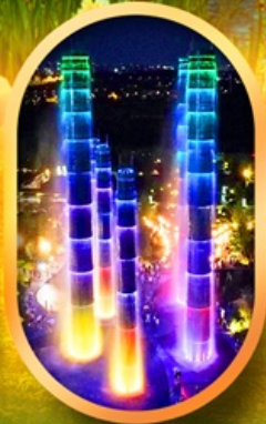
SKP Global Center