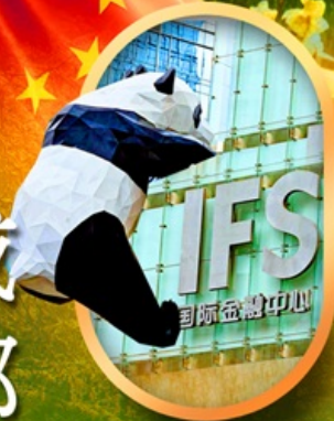
IFS หมีแพนด้าป็นตึก