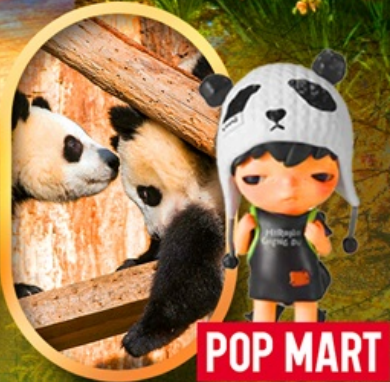
ศูนย์อนุรักษ์หมีแพนด้า POP MART

เจ๋งตุ ปี้ผิงโกว จิ้งจายโกว หมีแพนด้าตัวเป็นๆ