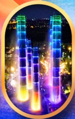
SKP Global Center