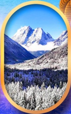
อุทยานสี่ครุณี