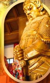
ขอพรวัดเขาง