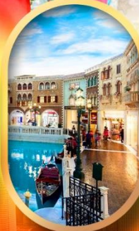
เดอะเวนิเซียน