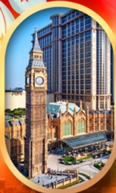
ลอนดอนเนอร์

เที่ยวคุ้ม!! บินเข้าฮ่องกง กลับมาเที่ยว บินเข้ากลับดี