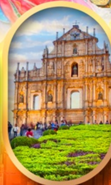
โบสถ์เซนต์พอล