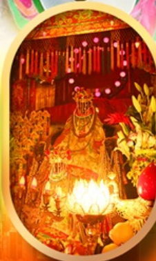
เจ้าแม่กวนอิมทองคำ