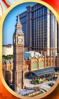
ลอนดอนเนอส์

เที่ยวคุ้ม!! บินเช้าฮ่องกง กลับมาเก้ บินเช้ากลับดึก