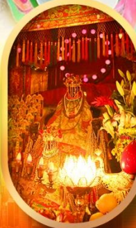
เจ้าแม่กวนอิมสองห้า