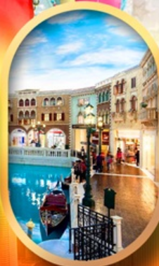
เดอะเวนิเซียน