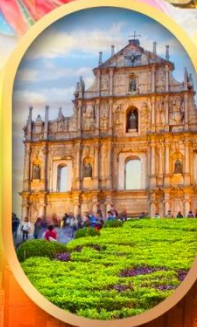
โบสถ์เซ็นต์พอล