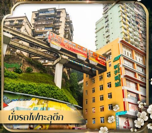
นั่งรถไฟกะลุดัก

คอนเฟิร์มออกเดินทาง ตั้งแต่ 10 ท่าน ขึ้นไป