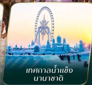
เทศกาลน้ำแข็ง นานาชาติ