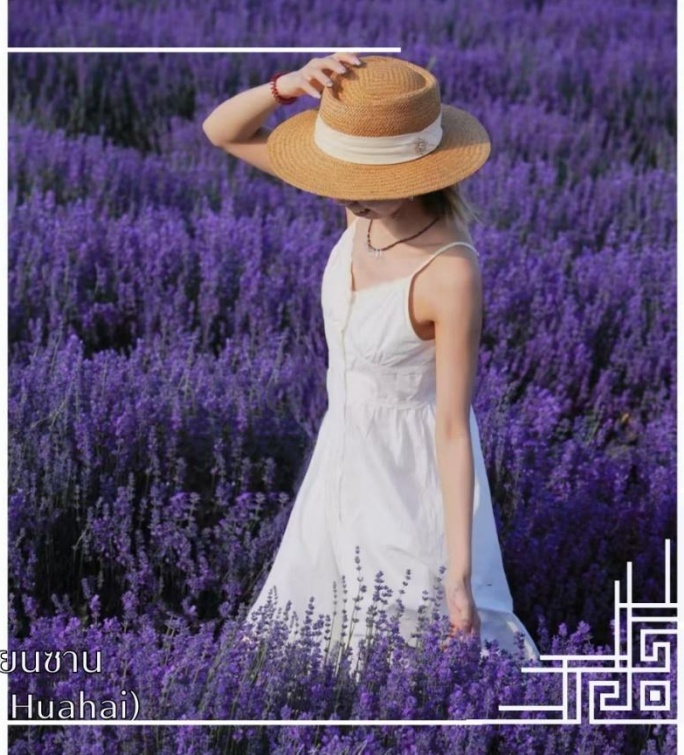
ทุ่งดอกไม้เทียนซาน (Yili Tianshan Huahai)

จากนั้นนำท่านสู่เมืองนาราลี (ใช้เวลาเดินทางประมาณ 3 ชั่วโมง)