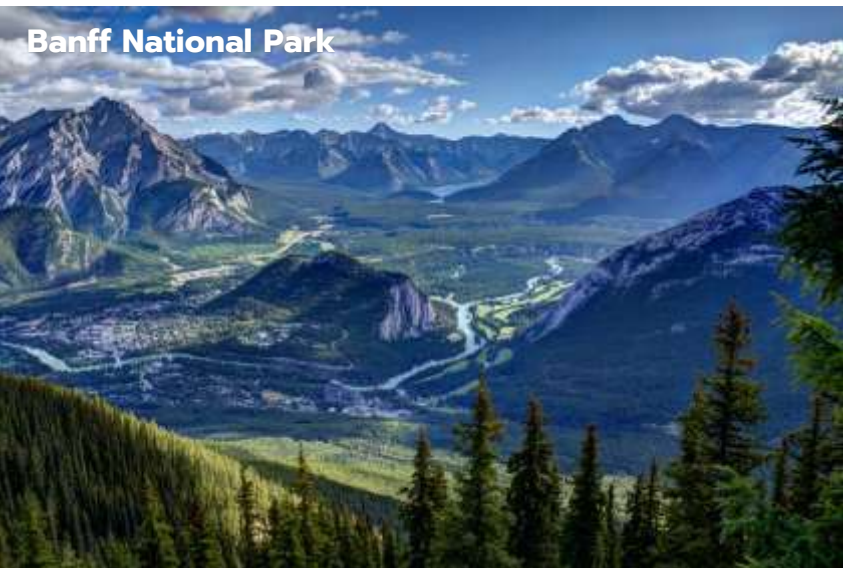
Banff National Park