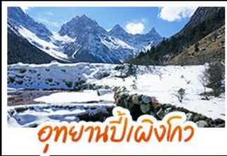
อุทยานปีติงโกว

หมีแพนด้าอนุเชลฟี • สะพานโบราณหนานเฉียว • ภูเขาหิมะวาวู เมืองโบราณกวนเซี่ย • อุทยานปีติงโกว • อุทยานต้ากู่ปิงชว่น ยอดเขาจ้อไบ๊ • วัดเป่ากั๋ว • ล่องเรือชมมรดกโลกหลวงพ่โตเล่อซาน วัดต้าเฉียว • ถนนไท่กู่หลี่ • ถนนชุนชี่ตู้ • ถนนโบราณชอยกว้างชอยแคบ