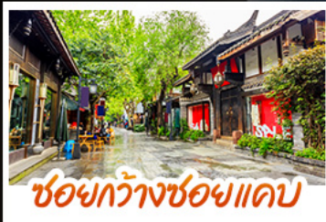
ชอยกวางชอยแพค