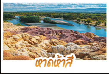
เขาดงเซ่