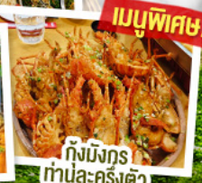
เมนูพิเศษ!