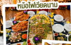
หม้อไฟเวียดนาม