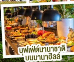
บุฟเฟ่ต์นานาชาติบนบานาฮิลล์