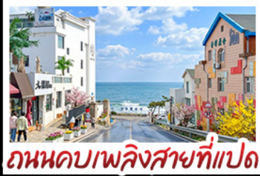
ถนนคอบาเพิลิงสายที่แปด