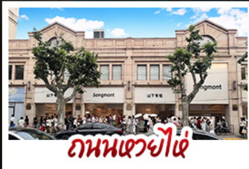
ถนนเซวี่ไต้