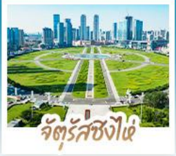
จัตุรัสซิงไฉ่