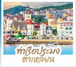
ทำเรือประมง ตาเหลียน