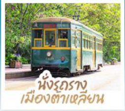
นังรถราง เมืองตาเหลียน