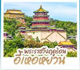
พระราชวังฤดูร้อน อี่เต๋อเฉ้ววัน

ทริปเดียวเทียวง 2 เมือง ปักกิ่ง-ต้าเหลียน • เทียวงจิบฟีลยุโรป ณ เมืองเวนิสแห่งต้าเหลียน • สัมผัสประสบการณ์ขึ้นกำแพงเมืองจีน ค่านจวียงทวน • ซ้อป ซิม ซิล ที่ถนนโบราณตงทวนและย่านชานหลู่ทวน