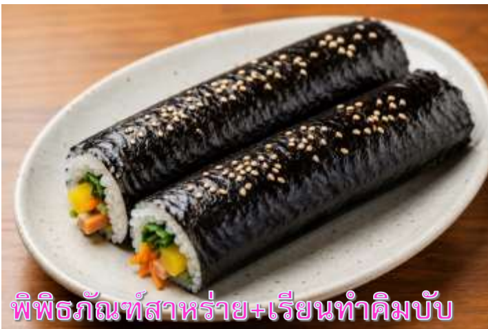
พิพิธภัณฑ์สำหรับาย+เรียนทำคิมบับ

เดินทางสู่ พิพิธภัณฑ์สำหรับาย ที่บอกเล่าเรื่องราว เกี่ยวกับสำหรับาย อาหารชั้นยอดของเกาหลี ที่กลายเป็นส่วนหนึ่งในวัฒนธรรมการประกอบอาหารของเกาหลี เรียนการทำคิมบับ เป็นกิจกรรม วัฒนธรรมเกาหลีที่เปิดโอกาสให้ได้เรียนรู้การทำอาหารประจำชาติ ร่วมกิจกรรมใส่ชุดฮันบกหลากหลาย ที่มีไว้ให้เลือก พร้อมถ่ายรูปกับฉากและพริอบที่เตรียมไว้เก็บเป็นที่ระลึกว่าครั้งหนึ่งเราได้เคยมาเยือน ดินแดนที่มีวัฒนธรรมหลากหลายเช่นนี้