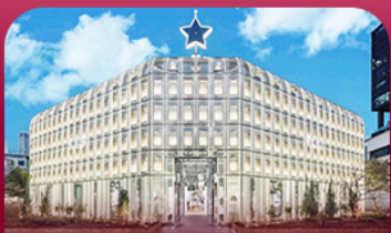
ย่านซองซู