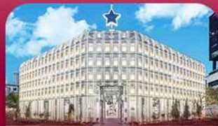
ชานซองซู