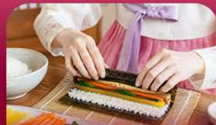
เรียงหน้าทำคิมบับ

สัมผัสเสน่ห์ฤดูหนาวของเกาหลีแบบอบอุ่นหัวใจพิเศษ! พักที่รีสอร์ท 1 คืน ท่ามกลางบรรยากาศหิมะขาวโพลน สนุกกับกิจกรรมฤดูหนาวยอดนิยม ทั้งสกี สโนว์บอร์ดและสโนว์สไลด์ ก่อนออกเดินทางสู่เกาะนามิ ดินแดนแห่งความโรแมนติก ชมสตรอว์เบอร์รี่หวานฉ่ำ สด ๆ จากฟาร์ม พร้อมเรียนทำคิมบับเมนูยอดฮิตสไตล์เกาหลี ปิดท้ายด้วยการช้อปปิ้งสุดฟินที่เมืองคยองและซองซู ย่านฮิดกึสายคาเฟ่และสายแฟชั่นห้ามพลาด