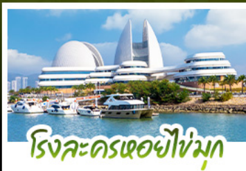
โรงละครเซอหยูซู่หมุก