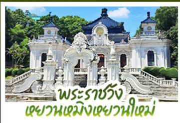
พระราชวัง เซวอนเหมิงเซวอนีเหม่