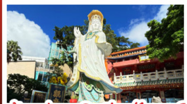
เจ้าแม่กวนอิมรัฟัสเบย์