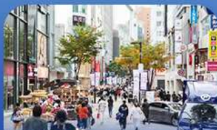
ช้อปบิงข่านเมียงดง