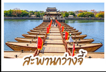
สะพานกว้างจี