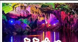
ถ้ำน้ำเป็นสี