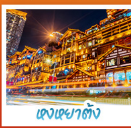
แสงอาคารตั้ง

อุทยานหลุมฟ้าสะพานสวรรค์ • อุทยานเขานางฟ้า • หงหยาดัง • ตึกพูยง ชั้น 22 • วัดต้าฉือ ชมรถไฟกะสุติก • สะพานโบราณหนานเฉียว • เมืองโบราณกวงเซี่ย • อุทยานภูเขาสีดรุณี อุทยานต้ากู่ปิงชาน • จตุรัสหยางเกียนหวู่ • รูปปั้นหมีแพนด้าอนเซลฟี • ร้านหมิงซือชงชู่ท้อ ถนนคนเดินซุนซีลู่ • หมีแพนด้าปิ่นตึก IFS • ถนนไม้กู่หลี่ • ถนนโบราณชอยกวางชอยแคบ