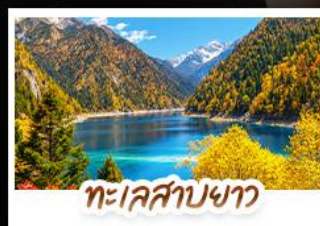
ทะเลสาบขาว