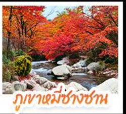
ภูเขาหมี่ชางชาน