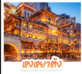
แดงเยาตั้ง