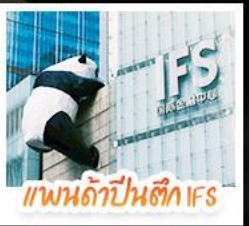
แพนด้าปาร์ค IFS