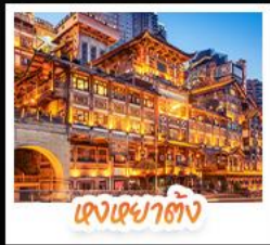
แสงเงาต้ง