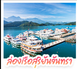
ล่องเรือสุริยันจันทร์รา