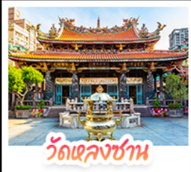
วัดเล่งชาน