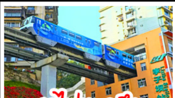
รถไฟทะลุคิก