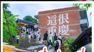
ตรอกซี้ซ่าวหลี่