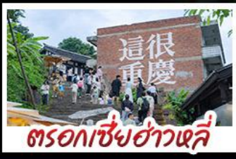
ตรอกเซี่ยอ่าวหลี่