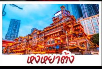
แดงเฉยาตัง