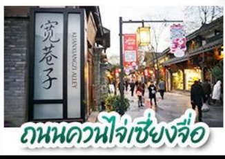
ถนนควานไห่จางชิ่งจื่อ