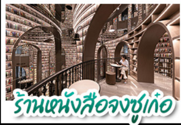
ร้านหนังสือจชชู่เก้อ

อุทยานสี่ครุณี - อุทยานป่ิงโถว - วัดต้าจื่อ หมี่แพนด้าออนเซลฟ์ - ร้านหนังสือจชชู่เก้อ ถนนโบราณชอยกวางชอยแคบ ช้อปิ้งถนนไท่กู่หลี่ + ถนนชุนชู่ CHENGDU TIMES OUTLETS