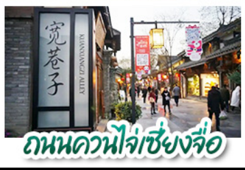
ถนนควนไฉ่ช่งจื่อ