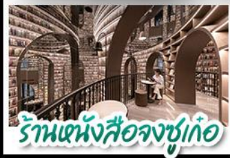
ร้านหนังสือจตุรพักตร์

อุทยานสัตว์ดรุณี - อุทยานป่าน้ำทิพย์ - วัดต้าจื่อ หมีแพนด้าบนเชลฟี - ร้านหนังสือจตุรพักตร์ ถนนโบราณชอยกว้างชอยแคบ ช้อปปิ้งถนนไท่กู่หลี่ + ถนนชุนชู่ CHENGDU TIMES OUTLETS