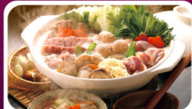
หม้อไฟสไตล์ญี่ปุ่น