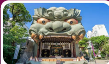
ศาลเจ้านัมบะ ยาชากะ