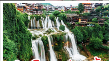
เมืองโบราณฟูแรงเจิน