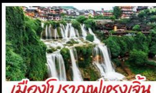
เมืองโบราณฝูเจียง