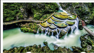
แกรนด์แคนยอนกงเหริน