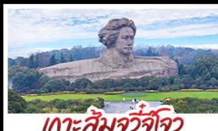
เกาะส้มจวีจี้โจว