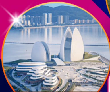
โรงละครลอยน้ำ