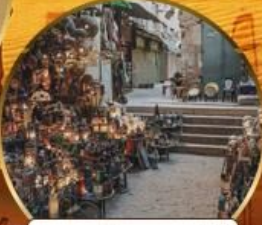
ตลาดบ้านเอลคาลิ