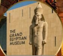
พีพีรภัณฑ์แกรนด์อียิปต์